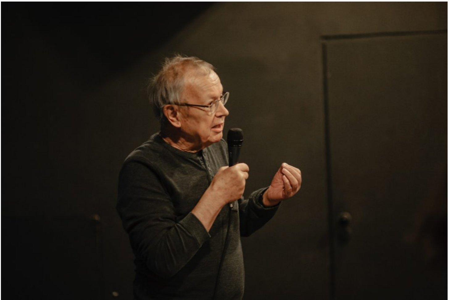
Martin Pollack in Lublin.

ostmitteleuropäische Geschichte mit Orten, Landschaften und Regionen verbunden ist. Ich stamme selbst aus einer Familie, die aus einem gemischtsprachigen, multiethnischen Raum kommt. Ich wuchs teilweise im Haus der Großeltern auf. Mein Opa kam aus den Gebieten des heutigen Sloweniens, die früher zu Österreich-Ungarn gehörten – aus der Untersteiermark, auf Slowenisch Spodnja Štajerska. Dort entwickelte sich schon im 19. Jahrhundert ein heftiger Nationalitätenkonflikt, den meine Familie hautnah erlebte und der schließlich die meisten von ihnen zum Nationalsozialismus gebracht hat. Deshalb weiß ich, wie wichtig es ist, dass man sich genau anschaut, was damals passiert ist. Dass man sich dieser Dinge entsinnt, dass man sie benennt, dass man nichts verschweigt. Wir müssen alle Geschichten – die kleinen, peinlichen, schmerzlichen, manchmal lächerlichen Geschichten – erzählen. Nichts auslassen, nichts verdecken, nichts zudecken. Auch meine jetzige Heimat Südburgenland ist ein multiethnischer Raum, seit Jahrhunderten von Deutschen, Roma, Ungarn und Kroaten bewohnt. Solche Räume werden in Europa leider weniger, aber sie funktionieren immer noch, an sie sollte die europäische Erinnerung gebunden sein.