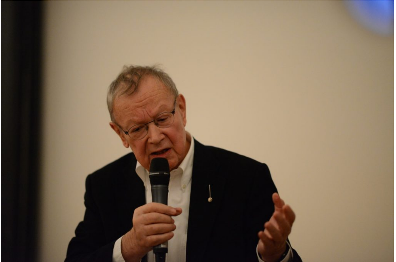
Martin Pollack in Potsdam.