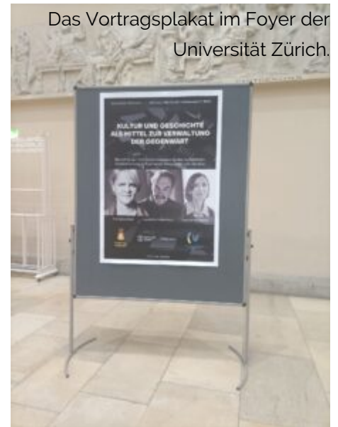
Das Vortragsplakat im Foyer der Universität Zürich.