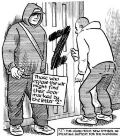
"Z": THE UBQUITOUS NEW SYMBOL INDICATING SUPPORT FOR THE INVASION

My legs shook with fear when shelling started closely, but having the dogs helped me.